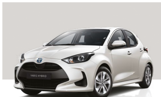
לבן פנינה מטאלי 089