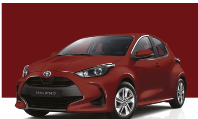
אדום רוז מטאלי 3U5