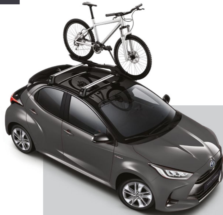
מוטות רוחב, עבור מגוון אביזרי גג ומתקני אופניים