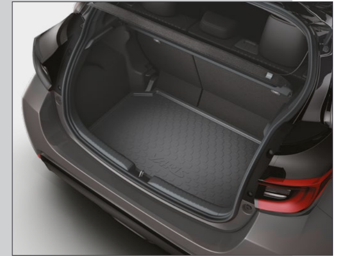
אמבטיה לתא המטען המספקת הגנה מפני לכלוך ומפני החלקה של ציוד וסחורה