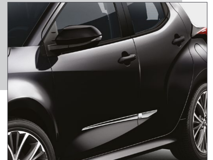
סט פסי קישוט בצבע כרום שייספקו ליאריס שלך מראה קלאסי בעל נגיעה אלגנטית