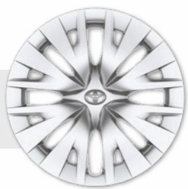
חישוקי פלדה 15"

*מומלץ לבדוק את תאימות הטלפון הנייד שברשותך למערכת ה-Bluetooth המותקנת ב-YARIS, אשר הינה מסוג: Toyota Touch 2. את הבדיקה ניתן לעשות בלינק הבא: www.toyota-tech.eu/bluetooth/search.aspx **נכון למועד פרסום קטלוג זה, אפליקציית Android Auto אינה זמינה בישראל.