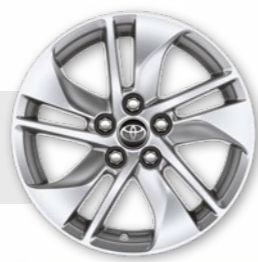
חישוקי סגסוגת קלה 15"