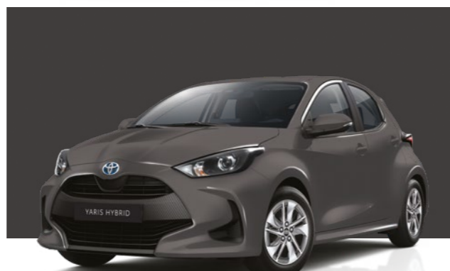
אפור מטאלי 1G3