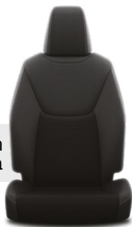
ריפודי בד בצבע שחור