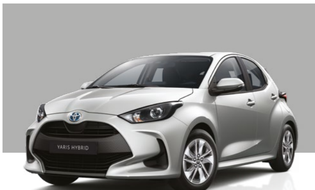
כסוף מטאלי 1L0