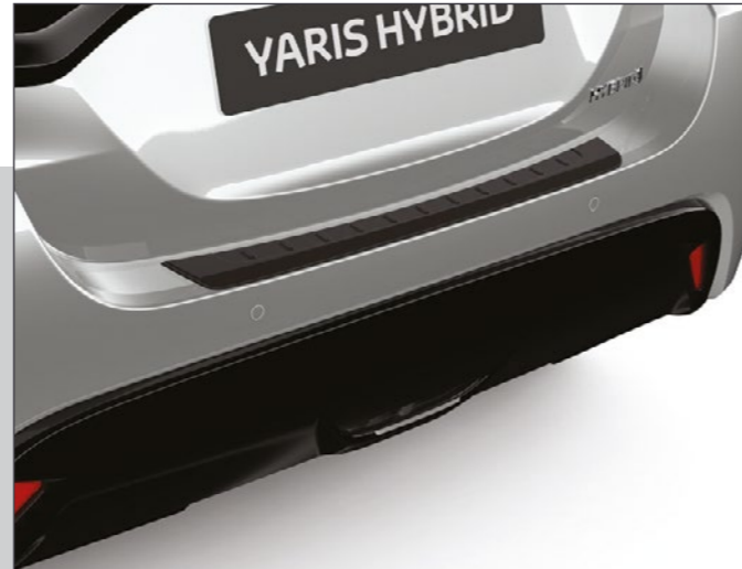
מגן פגוש אחורי המגן על הפגוש בעת טעינה ופריקה של סחורה מתא המטען