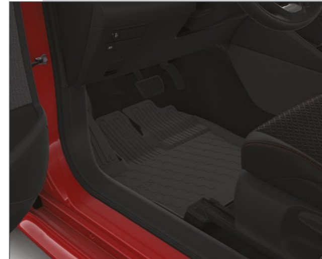
שטיחי גומי המגנים על פנים הרכב מפני לכלוך וניתנים להסרה ולניקוי פשוט