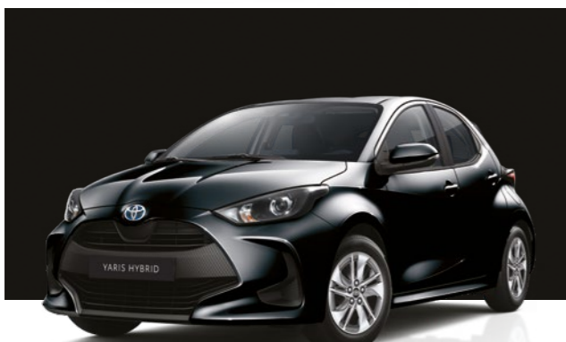
שחור מטאלי 209