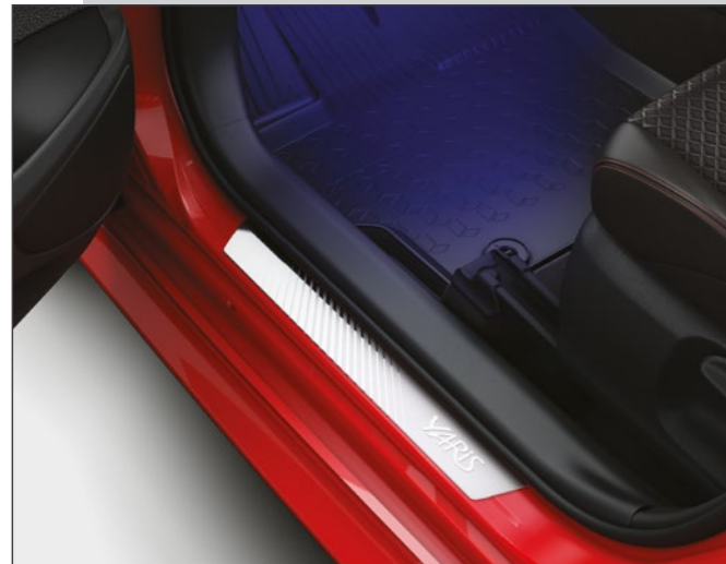
סט קישוטי סף קדמיים מקוריים היוצרים רושם מידי של סטייל, ובמקביל מגנים על סף הדלת מפני לכלוך ושריטות