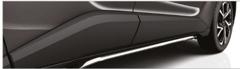
מגן צד תחתון