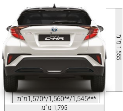
מ"מ 1,570*/1,560**/1,545*** מ"מ 1,795