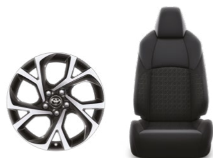
חישוקי סגסוגת קלה 18" ריפוד בד מהודר בצבע שחור