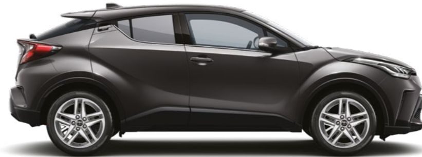
אפור גרניט מטאלי 1G3