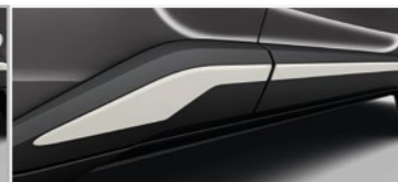
פס קישוט צד