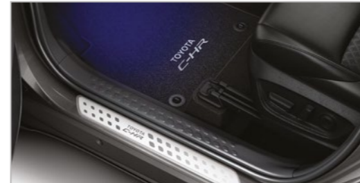
תאורת רגליים כחולה