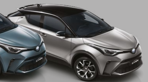
אפור תכלת / שחור - 2TH - 202/1K3