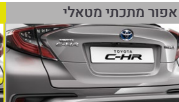
אפור מתכתי מטאלי