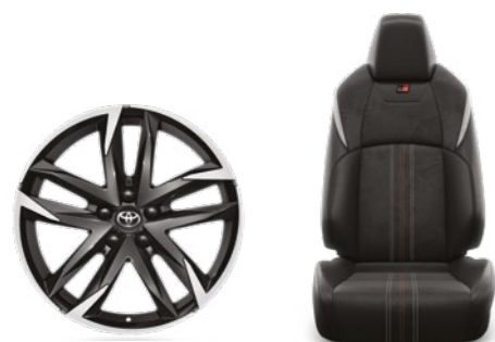
חישוקי סגסוגת קלה 19" עם ריפוד אלקנטרה מושבים ספורטיביים