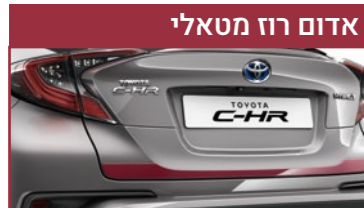
אדום רוז מטאלי