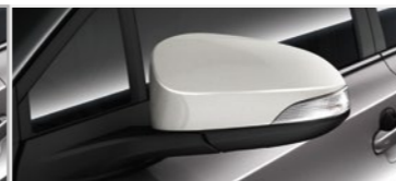
כיסוי מראות צד