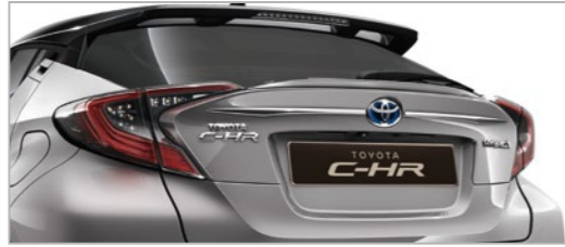
קישוט אחורי עליון בצבע ניקל