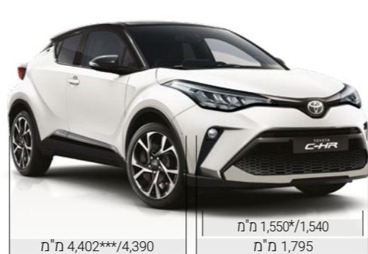
מ"מ 4,402***/4,390 מ"מ 1,550*/1,540 מ"מ 1,795

*מתייחס לדגם C-ITY. **מתייחס לדגם C-HIC. ***מתייחס לדגם GR SPORT