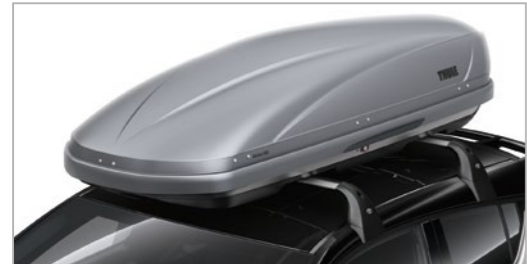
ארגז אחסון עליון