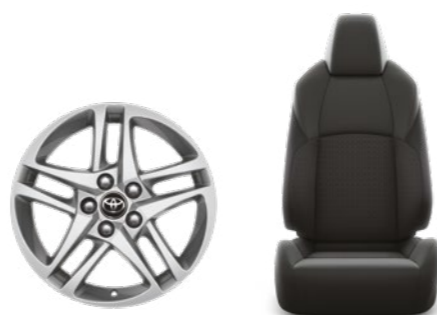
חישוקי סגסוגת קלה 17" ריפוד בד מהודר בצבע שחור