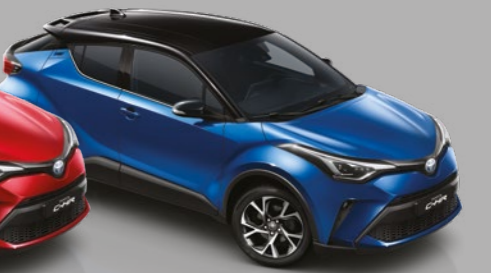
אדום עז / שחור - 2TB - 202/3U5