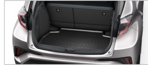
ציפוי מגן מפלסטיק שחור לתא מטען