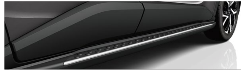
מדרגות צד אלומיניום