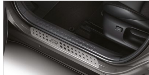
סט קישוט סף