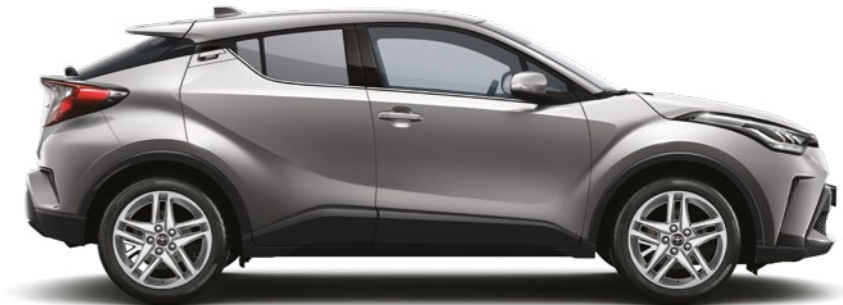
אפור מתכתי מטאלי 1A0