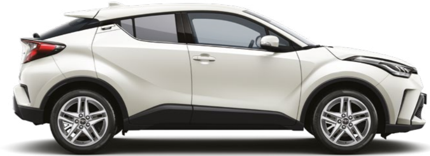
לבן פנינה מטאלי 070